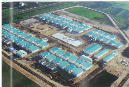
Projet de village "développement durable".

Une association constituée entre les districts 2070 (Toscane), 2080 (Rome, Latium et Sardaigne), 2032 (Ligurie) et 2100 (Campanie et Calabre) s'appelle "Forum de la frange côtière de la mer Ligure, de la mer Tyrrhénienne et de la mer de Sardaigne". Régulièrement, elle organise avec la participation de ses 42 clubs membres, un congrès avec un thème relatif aux problèmes environnementaux, économiques, touristiques. 32 séminaires ont déjà été organisés sur différents sujets, avec la participation de leaders et d'experts.