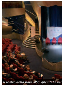
Il teatro della nave MSC Splendida nel