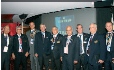
Il gruppo dei dirigenti rotariani magrebini ed italiani presenti ai lavori

tra le realtà italiana e spagnola. Il tema immigrazione sarà, anche per questo, trattato nel prossimo Forum della Pace mondiale con l’appuntamento di Berlino “Pace senza frontiere” in relazione alla missione assunta in questo anno 2012-2013 dal Presidente Internazionale Sakuji Tanaka: “Pace attraverso il servizio”. Essendo tutto ciò basato sulla comprensione e cooperazione tra le nazioni, non è un caso che le Commissioni Interpaese abbiano in questa conferenza internazionale un ruolo portante e che Gianni Jandolo, Presidente dell’Executive Board dei Comitati Interpaese (2012-2014), abbia voluto sostenere l’organizzazione di questo XXXIII Forum anche con la presenza ai la-